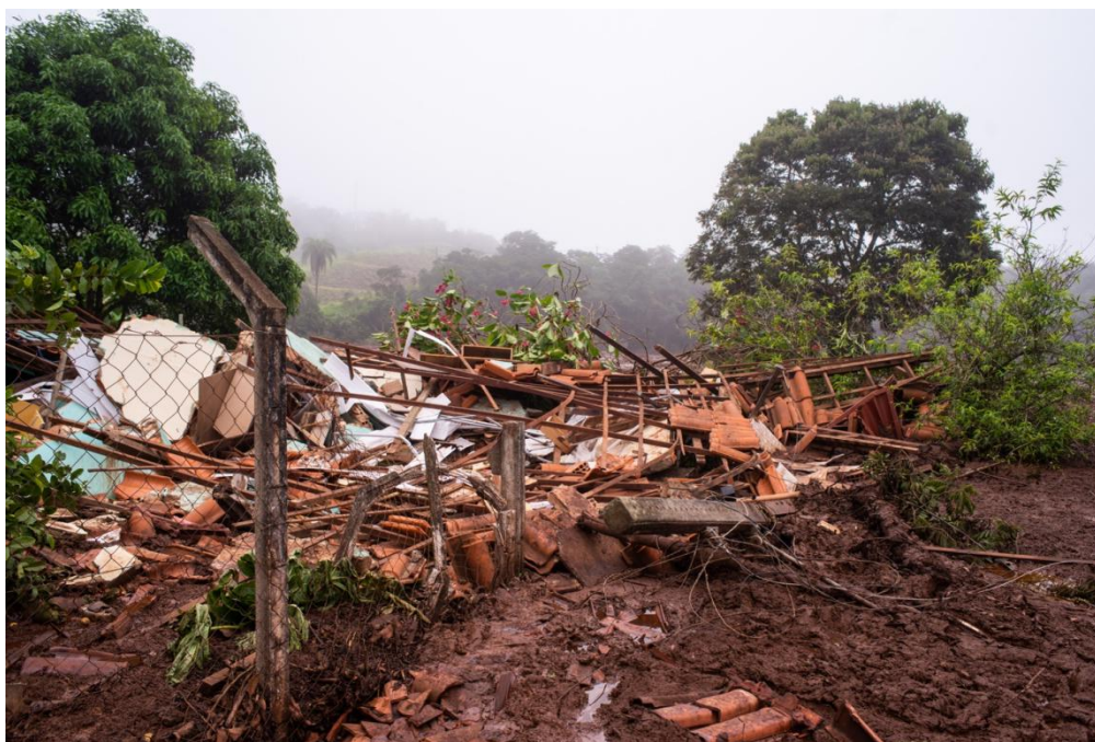
淡水河谷在巴西布鲁马迪纽(Brumadinho)的一座尾矿坝溃坝后，一栋房屋的残砖碎砾滑入了尾矿泥沼中。

自 2011 年通过《指导原则》以来，在全球业务中，包括在供应链中尊重人权已成为对