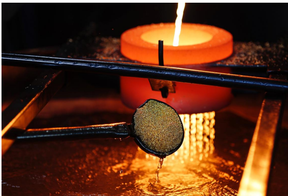
在精炼过程中，金铸件颗粒被舀入金属勺中。

精炼企业和冶炼企业应将这些信息以及已识别的风险和为应对这些风险而采取的措施提供给下游实体——无论是金银银行、珠宝制造商、汽车品牌商、电容器制造商还是任何其他使用 3TG 的企业。 41 报告必须足够详细，以便供应链中的其他企业能够在适当的时候采取行动帮助应对风险。 42 精炼企业和冶炼企业的下游企业应审查其直接或间接地向其采购或购买，抑或投资的冶炼企业和精炼企业的供应链尽职调查情况，并根据所提供的信息评估其尽职调查实践是否符合国际负责任采购标准。 43