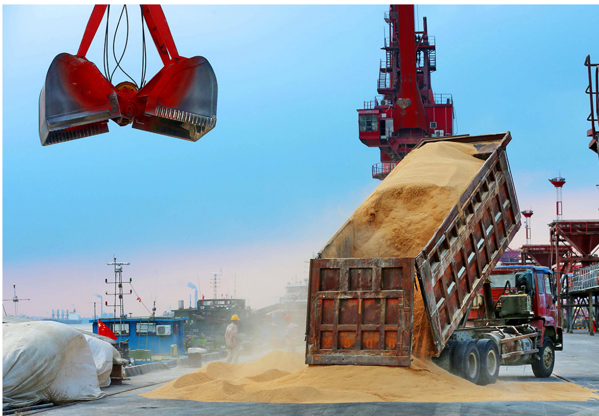
巴西进口大豆制品在中国江苏

同时，中国还应考虑加强现行法律对金融业环境和社会责任的要求。例如，《中华人民共和国中国人民银行法》和《中华人民共和国商业银行法》目前正在修订中。 40 中国可以把握当前这个机遇，引导银行业为国家气候和生物多样性提供明确支持。我们建议上述两部法律明确界定银行业的环境责任，并强制性要求企业对环境和社会风险纳入其风险管理机制、并且将其如何实践环境责任和减低环境和社会风险进行信息披露。