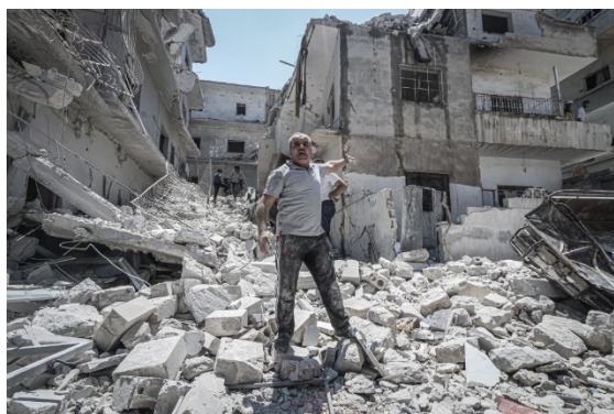
Мужчина, кричащий над руинами своего дома после воздушных ударов по Идлибу российских и сирийских вооруженных сил, 27 июля 2019 г.