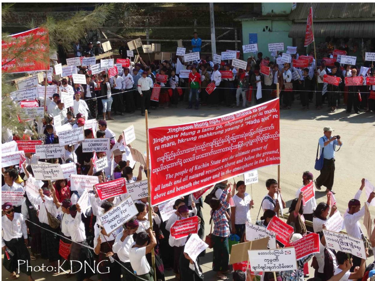
2014 ning November shata hta, lungseng muklum rai nga ai Hpakant jauman masha marai 2000 ram kawng asuya licence lu ai lungseng company ni a roirip dangsha ai lam hpe ninghkap ninggun madun ai lam galaw wa sai. Nkau mi hpyi shawn ai gaw, kri shapraw taw ai company ni yawng hpe Jinghpaw mungdaw majan zim ai ten du hkra jahkring tawn ra ai ngu nna hpyi shawn wa sai.

“Lawu de na ntsa de lung wa ai ladat hte bawngring lam galaw ai gaw jauman mungshawa ni hpe bungli dawdan jahkrat ai hta shanglawm shangun ai zawn rai nna shanhte a akyu hpe lu galaw ya nga ai. Dai zawn shanhte a shira nhprang sutrai ni gawnhkang hpajang ai hta jauman masha ni nlu shanglawm ai rai yang, mung masa manghkang ni grau sawng wa chye ai hte mungdan a simsa lam hpe sa ahtu hkra shangun chye na re” KDNNG/ Kachin mungdaw Shingra Nhprang sutrai Bawngring Policy Bawngban Laika