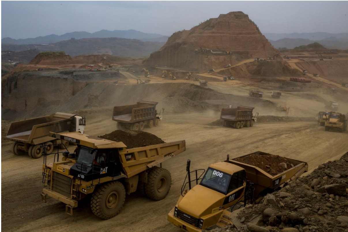
Caterpillar Inc. gaw jak-rai ni hpe dut shabra nga ai mungkan hpaga hpung langai rai nhtawm, Hpakant lungseng htu-shaw ai lam hta mung ra ai, jak arung arai ni hpe dut jaw ai lam galaw nga ai. Global Witness kawn tam-sawk mu ai gaw, shi hte matut mahkai bungli rau jawm galaw nga ai, Myenmung kata na company nkau mi nga nga ai hta, dai company ni hpe U.S asuya kawn pat-hkum da ai jahpan kaw lawn ai, nsin nanghpang hkawhkam wa Wei Hsueh Kang up-hkang nga ai hpe sawk mu ai re.