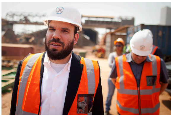
Dan Gertler visite un site minier congolais en 2012. Malgré les sanctions dont il fait l'objet depuis 2017, le milliardaire israélien n'a pas modifié ses pratiques commerciales.

Les États-Unis utilisent les sanctions à la fois comme mesure punitive et comme moyen d'encourager les changements de comportement. D'emblée, nos recherches suggèrent que Dan Gertler n'a pas changé d'un iota. À peine sanctionné, au lieu de se « ranger » et de quitter la RDC, il apparaît qu'il s'est tourné vers une banque accommodante, un réseau de mandataires, et un réseau clandestin complexe commercial et bancaire. Ce réseau l'aurait aidé à contourner les sanctions américaines, tout en continuant possiblement à acquérir des actifs miniers en RDC dans des circonstances douteuses – alors que les sanctions visaient justement à réprimer de telles activités. Il est possible que des personnes sanctionnées soient retirées des listes de désignation si elles corrigent leur ligne de conduite. Mais dans le cas de Gertler, le bien-fondé de son statut d'individu sanctionné en vertu de la loi Global Magnitsky est irréfutable, du moins jusqu'à ce que les questions soulevées dans ce rapport ne fassent l'objet