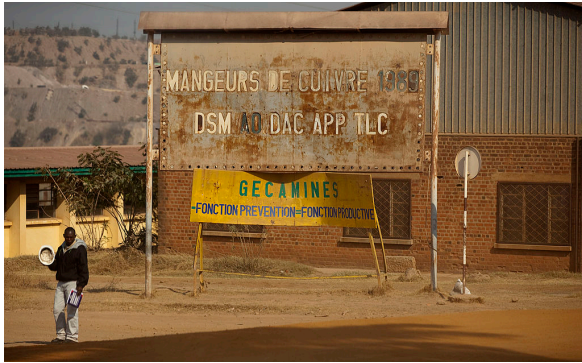
L'entreprise publique minière Gécamines, connue comme la « caisse noire » de la RDC en raison de la disparition de ses revenus.

le coup d'une enquête du Serious Fraud Office (SFO) au Royaume-Uni [voir l'encadré « ERG sous le coup d'une enquête pour corruption au Royaume-Uni »] 75 .