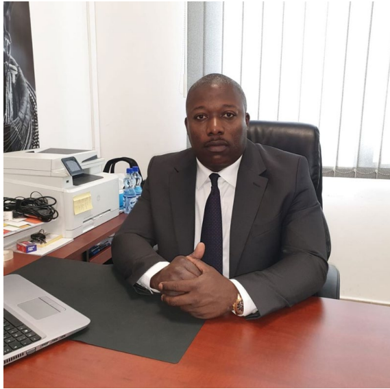
Alain Mukonda a versé 11 millions d'euros en espèces sur les comptes de sociétés liées à Gertler constituée peu de temps après l'annonce des sanctions. Facebook .

l'intermédiaire de sociétés basées dans des paradis fiscaux.