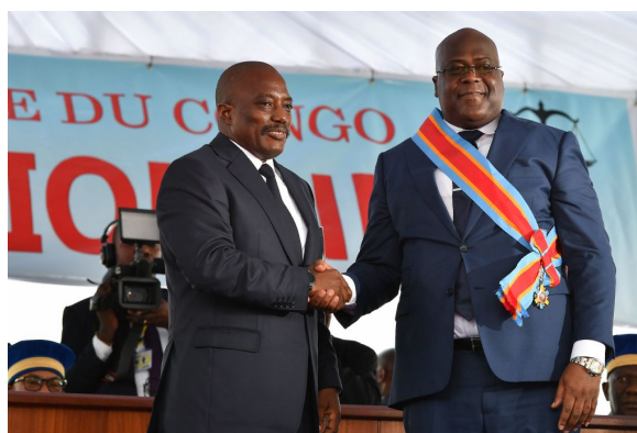
Le président congolais sortant Kabila serre la main du nouveau président Tshisekedi, le 24 janvier 2019. Kabila a conservé son influence sur de nombreuses institutions du pays.

En République démocratique du Congo, la plupart des opérations commerciales sont effectuées en dollars américains, et une grande partie de la richesse de Gertler repose sur des contrats libellés en dollars 33 34 . L'application des sanctions américaines représente donc un défi de taille pour Gertler : comment continuer à gérer ses finances si les banques refusent — ou du moins, sont censées refuser— de détenir des