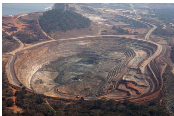
Malgré les sanctions, Gertler continue de recevoir de colossales royalties tirées de la mine de cuivre et de cobalt Mutanda exploitée par Glencore en RDC.

C'est ainsi que Glencore continue à verser à Gertler des revenus colossaux depuis 2017. L'organisation belge Resource Matters, spécialisée dans la transparence du secteur des ressources naturelles en RDC, estime qu'en 2018 uniquement, Glencore devait 110 millions de