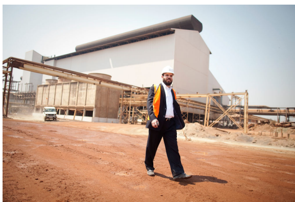
Dan Gertler a été sanctionné par les États-Unis pour « contrats miniers et pétroliers corrompus » en RDC.

De plus, les personnes fournissant tout type de soutien à une entité sanctionnée (d'ordre financier, matériel ou technologique) peuvent également s'exposer à des sanctions 25 . L'OFAC peut sanctionner toute entreprise non-