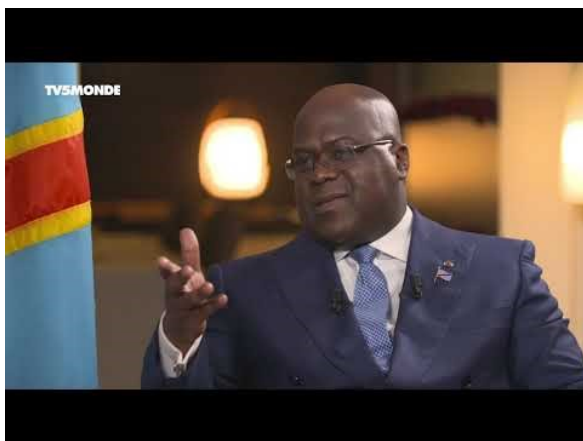
Le Président Félix Tshisekedi cite Afriland Bank lors d'une interview télévisée en septembre 2019.

L'année où Gertler et les diverses entités citées dans ce rapport commencent à utiliser les services d'Afriland RDC, les revenus de la banque