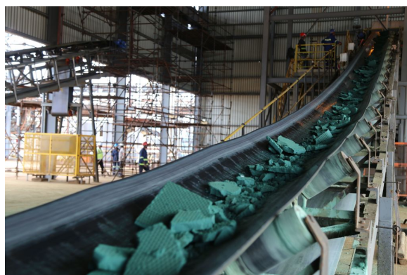
Un tapis convoyeur achemine des morceaux de cobalt dans une usine de Lubumbashi. La RDC abrite près de 50 % des réserves mondiales de cobalt.

Le riche filon de cuivre d'Afrique centrale, la Copperbelt, couvre une large bande dans les provinces méridionales de RDC, anciennement connue sous le nom générique de Katanga. Dans les années qui ont suivi la Deuxième guerre du Congo, alors que l'économie congolaise se libéralisait, de grandes entreprises minières ont commencé à affluer vers le Katanga en quête de gisements de cuivre, dont la région est réputée pour la pureté. Malgré des prix fluctuants, la révolution de la « green tech » entraîne une montée en flèche de la demande de cobalt, un produit dérivé du cuivre indispensable à la fabrication de batteries.