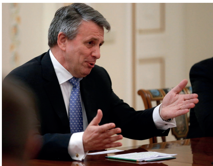
壳牌首席执行官范伯登称，指向壳牌可能参与了一场数额巨大且掠夺了尼日利亚人民血汗钱的受贿案的系列邮件不过是“酒吧里的闲扯”。

“不要主动提供任何未被要求的信息，”范伯登在一次此前未被报道的由荷兰警方监听的通话中告诉时任壳牌首席财务官的西蒙·亨利。这两名壳牌高管一致认为最好不要把警方突击检查的事情告诉股东。“最不希望看到的当然就是要求我们在证券交易所进行信息披露，”范伯登说。“我们只说要求我们提供信息，其它没什么好说的。”