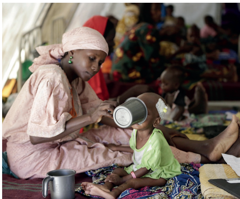
用于购买石油区块的资金总额相当于联合国估算的对当前饥荒采取行动所需资金的1.5倍——但这笔钱进入了私人的腰包。