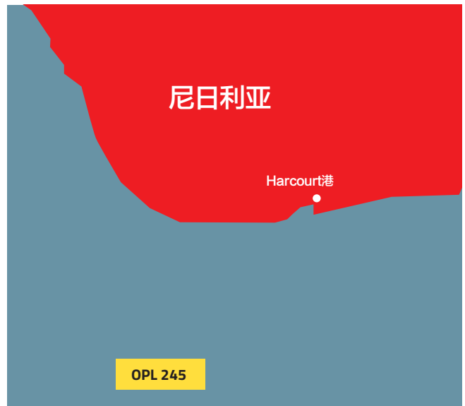
地图显示OPL 245油田位于尼日利亚近海。

两家公司都表示，它们已经委托了分开的、独立的调查。“没有发现任何非法行为”，埃尼集团表示，并指出它“直接与尼日利亚政府达成了交易，没有任何中介参与”。壳牌指出，它与有关当局分享了针对OPL 245交易调查的关键发现。