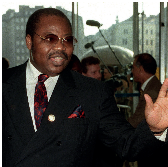
尼日利亚前石油部长、已定罪的洗钱者丹·埃泰特从OPL 245交易中大笔钱财。

勘探与生产负责人博德还及时向傅赛汇报谈判进展情况。博德在2010年3月通过邮件将OPL 245的交易草案发给傅赛，并告诉他“考虑到涉及的历史和政治/商业原则问题，项目需要你的正式支持。”