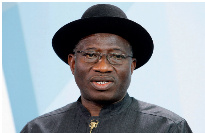
壳牌公司高管被告知，交易相关资金很可能流向尼日利亚最有权势的人手中，包括时任总统的古德勒克·乔纳森。

对于埃泰特来说，上层的变动是有用的——乔纳森是他的老朋友。根据科普莱斯顿的笔记，乔纳森曾经是埃泰特孩子们的老师。