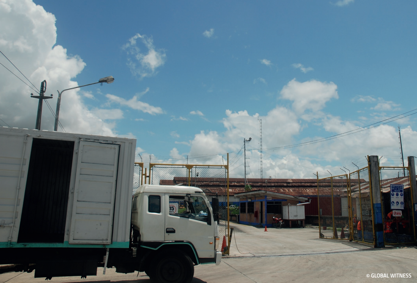
Abajo Entrada a las autoridades portuarias en Iquitos, donde llegó madera antes de que fuera subida a bordo del Yacu Kallpa.