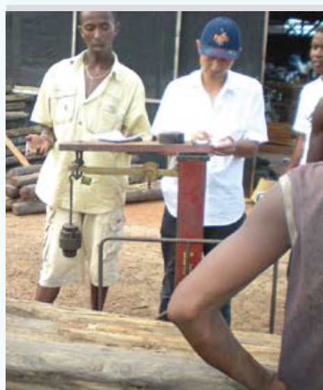
Image 3 : Un acheteur chinois pèse le bois de rose destiné à l'exportation dans la Région Sava à Madagascar