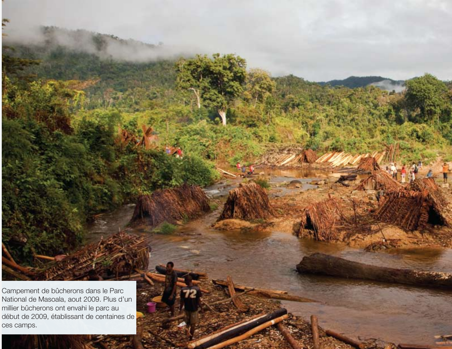
Campement de bûcherons dans le Parc National de Masoala, aout 2009. Plus d'un millier bûcherons ont envahi le parc au début de 2009, établissant de centaines de ces camps.