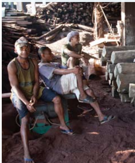
Image 2 : Des ouvriers d'une scierie à Antalaha, qui entrepose des grumes de bois de rose et produit de grandes quantités d'ébène scié