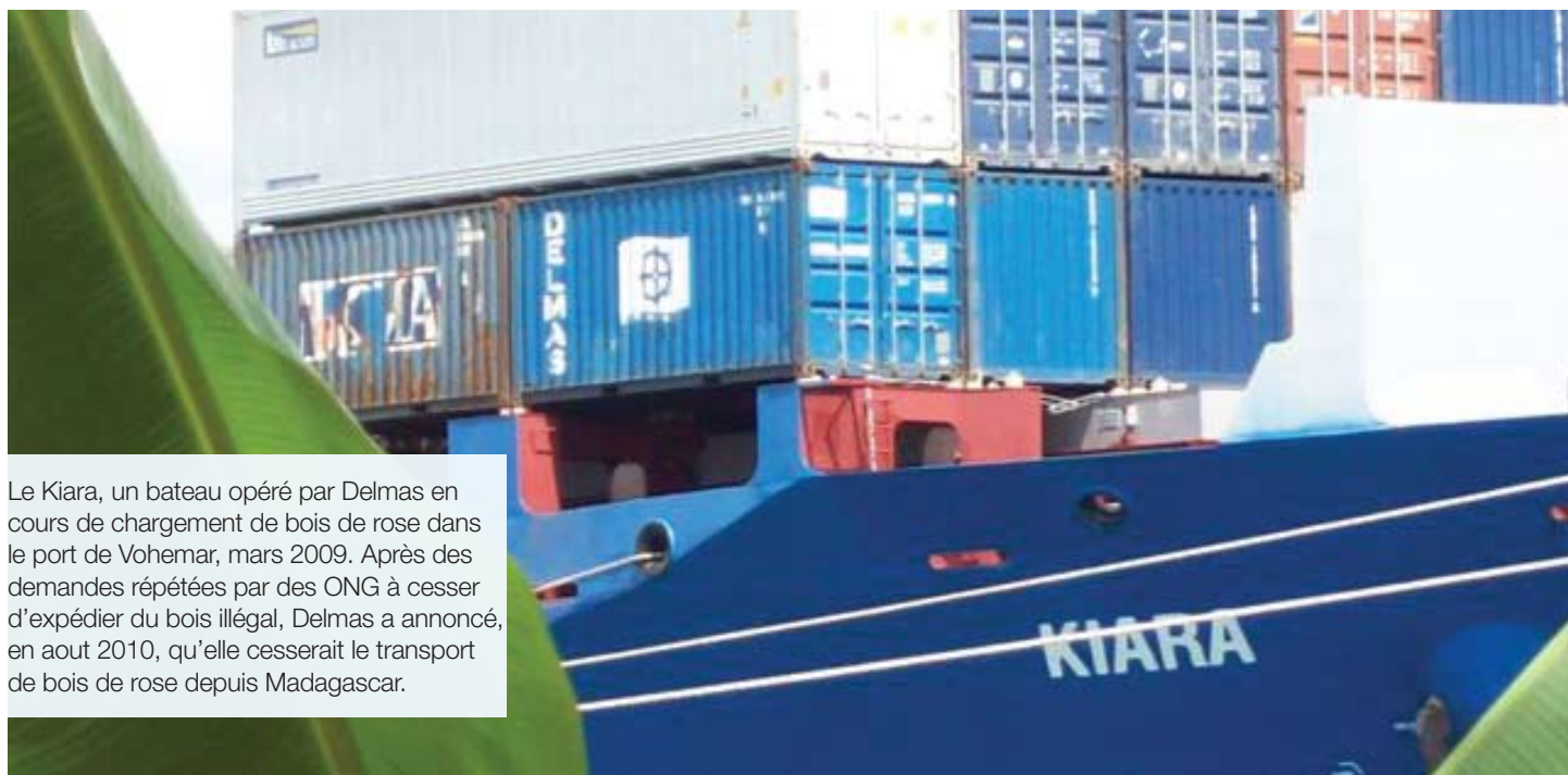
Le Kiara, un bateau opéré par Delmas en cours de chargement de bois de rose dans le port de Vohémar, mars 2009. Après des demandes répétées par des ONG à cesser d'expédier du bois illégal, Delmas a annoncé, en août 2010, qu'elle cesserait le transport de bois de rose depuis Madagascar.