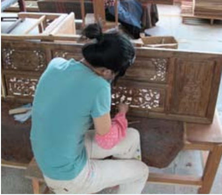
Image 5 : Sculpture traditionnelle à une usine de meubles à Shenzhen. Ce genre d'usines transforment des grumes de Madagascar aux articles de luxe précieux.