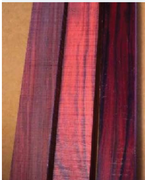
Image 8 : Du bois de rose malgache vendu par un distributeur américain de produits ligneux semi-finis. Le distributeur avertit qu'il est désormais difficile de s'en procurer