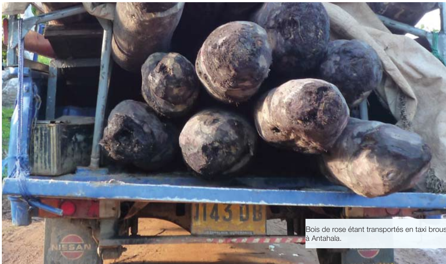
Bois de rose étant transportés en taxi brous à Antahala.