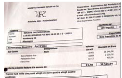
Image 1 : Document attestant l'expédition de bois précieux de la Sté. THUNAM à Theodor Nagel en 2009.

Bien qu'il soit encore trop tôt pour émettre des commentaires sur l'effet à long terme de l'investigation sur Gibson Guitar aux États-Unis, la