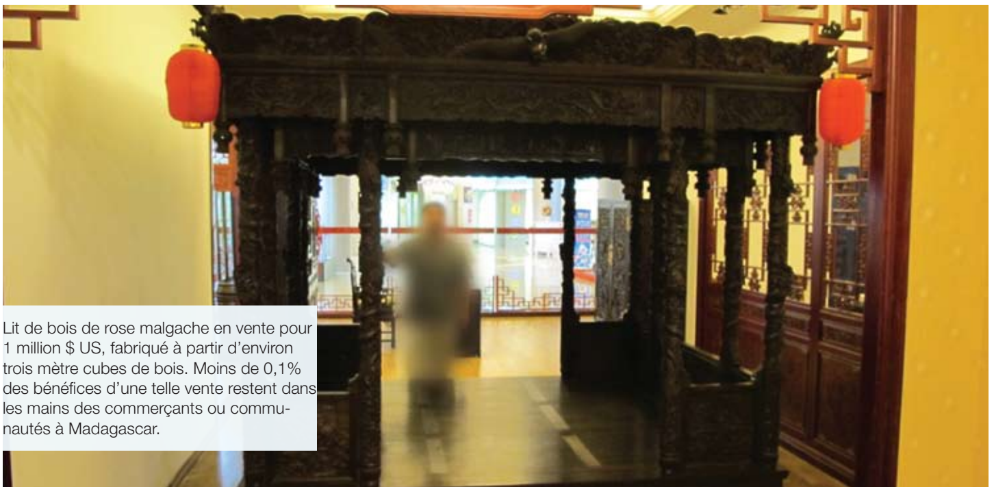
Lit de bois de rose malgache en vente pour 1 million $ US, fabriqué à partir d'environ trois mètres cubes de bois. Moins de 0,1% des bénéfices d'une telle vente restent dans les mains des commerçants ou communautés à Madagascar.

L'enquête du Service américain en charge de la Pêche et de la Faune (US Fish & Wildlife Service) sur l'importation soupçonnée par Gibson Guitars d'ébène malgache récoltée illégalement semble avoir profondément affecté la demande de bois précieux malgache aux États-Unis et en Europe. Si l'on y ajoute la législation adoptée aux États-Unis et dans l'UE sur l'importation de bois obtenu illégalement, on est en droit d'espérer que ces négociants chercheront activement à s'assurer que leurs chaînes d'approvisionnement sont au-dessus de tout soupçon avant la conclusion de l'affaire Gibson.