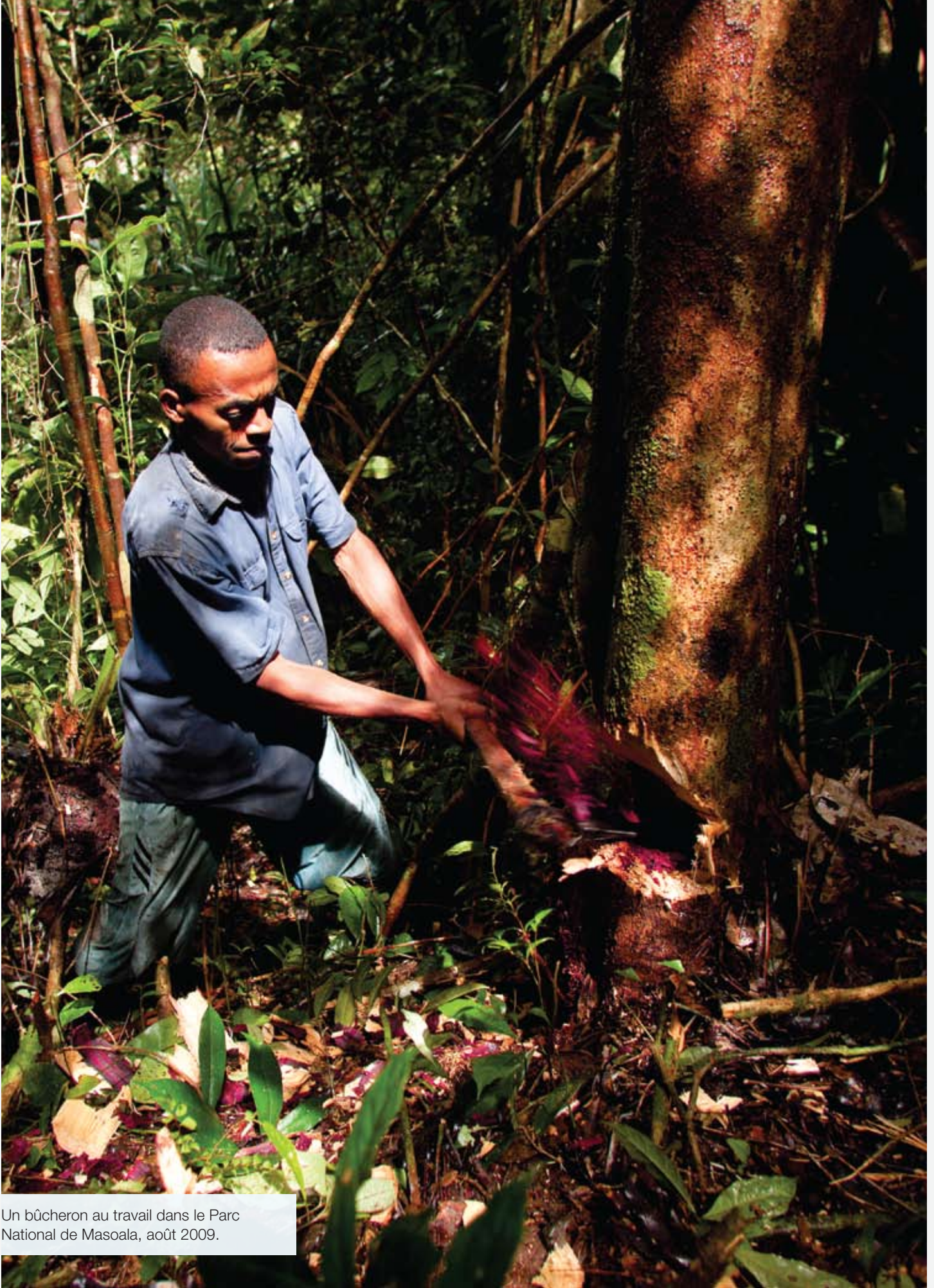
Un bûcheron au travail dans le Parc National de Masoala, août 2009.