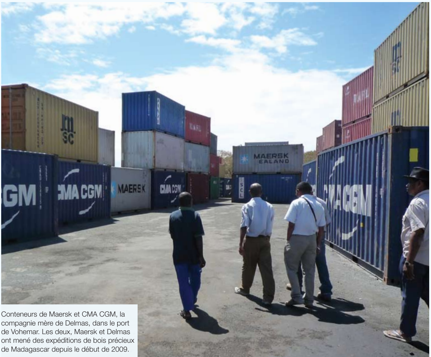
Conteneurs de Maersk et CMA CGM, la compagnie mère de Delmas, dans le port de Vohemar. Les deux, Maersk et Delmas ont mené des expéditions de bois précieux de Madagascar depuis le début de 2009.

À la suite des pressions exercées sans relâche par Global Witness et l'EIA et des campagnes publiques lancées par des organisations environnementales et de conservation de la nature, la compagnie de transport maritime française Delmas a déclaré dans un courrier daté du 5 août 2010 et adressé aux deux organisations qu'elle avait cessé de transporter du bois de rose de Madagascar. Cette initiative fait suite à l'entrée en vigueur du Décret 2010-141 interdisant à nouveau toute exportation de bois dur précieux. Nous continuons de surveiller l'évolution de la situation et les flux des marchandises transportées par voie maritime.