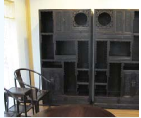
Image 7 : Le prix de vente au détail de la vitrine en bois de rose ci-dessus est d'environ 60 000 $

D'après les estimations, la Chine compterait entre 300 et 500 usines. Une usine typique emploie environ de 150 à 300 ouvriers, supervisés par une poignée des tailleurs très chevronnés. La technique du ciselage se transmettant exclusivement de génération en génération, la plupart des usines manquent de main-d'œuvre, et les ouvriers sont bien payés. Un tailleur en chef peut gagner jusqu'à 100 000 $ par an, et un employé de rang inférieur, 10 000 $.