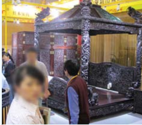
Image 6 : Du mobilier en bois de rose exposé dans un salon de professionnels à Shanghai. Le lit à droite est vendu 800 000 $