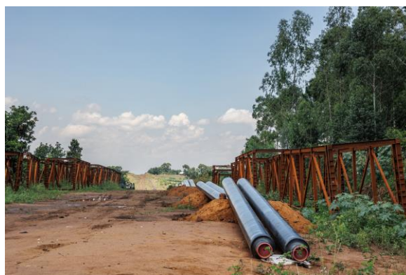
Travaux sur l'oléoduc à Hoima, en Ouganda

Depuis la découverte de pétrole dans la faille d'Albertine en Ouganda en 2006, son exploitation est devenue le symbole des ambitions du président Yoweri Museveni. Yoweri Museveni, qui est au pouvoir depuis 37 ans, l'a décrit comme « son pétrole » et il a construit la stratégie de développement du pays sur celui-ci. Il a affecté des centaines de millions de dollars au développement d'infrastructures pour l'oléoduc, notamment en construisant un réseau routier, ce qui a laissé le pays lourdement endetté. 5