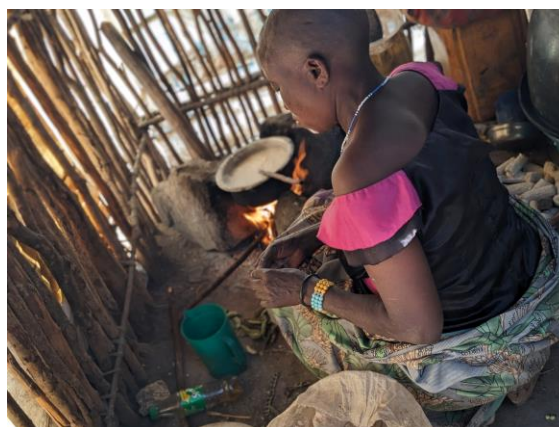
Femme d'une population affectée par l'oléoduc en Tanzanie. Green Conservers

De nombreux habitants que nous avons interrogés n'ont pas accès au soutien des groupes de la société civile et ceux qui y ont accès ont souvent peur de les rencontrer. Plusieurs d'entre eux ont été traînés devant les autorités et questionnés sur leurs liens avec les groupes de la société civile et leur opposition à EACOP. Un homme de Tanga a déclaré que les habitants devaient obtenir la permission des représentants de l'EACOP pour rencontrer les organisations de la société civile. De manière générale, les groupes pro-gouvernement semblent être favorisés. 8