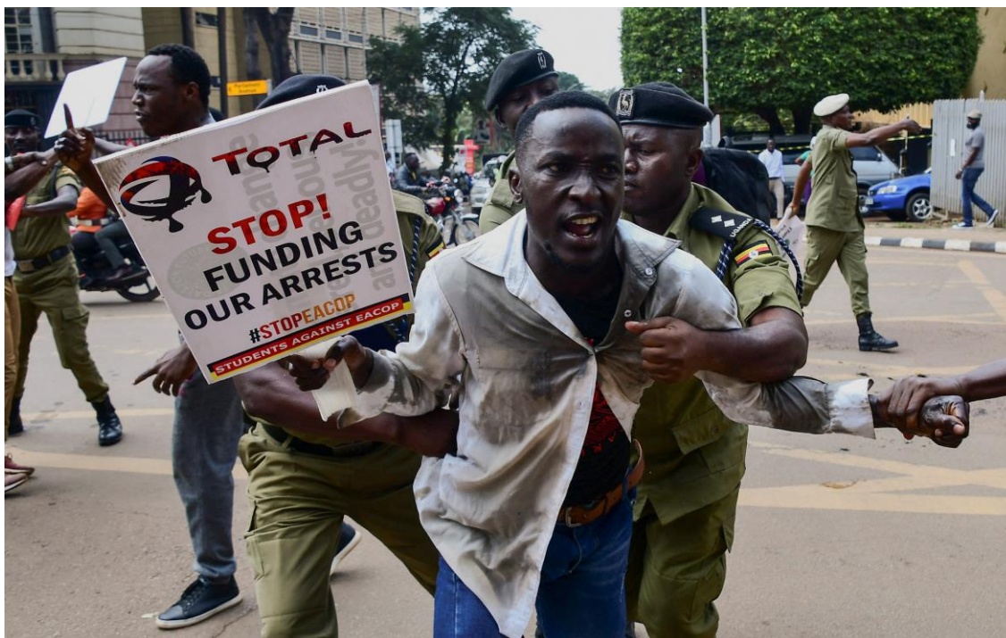
Quatre étudiants ont été arrêtés avec violence en septembre 2023 pour avoir manifesté contre l'EACOP.

« L'Ouganda est un pays libre. Avez-vous eu de problèmes pour venir faire votre rapport ici ? Vous n'avez pas été inquiétés. Tous les pays voisins de l'Ouganda sont beaucoup moins libres ».