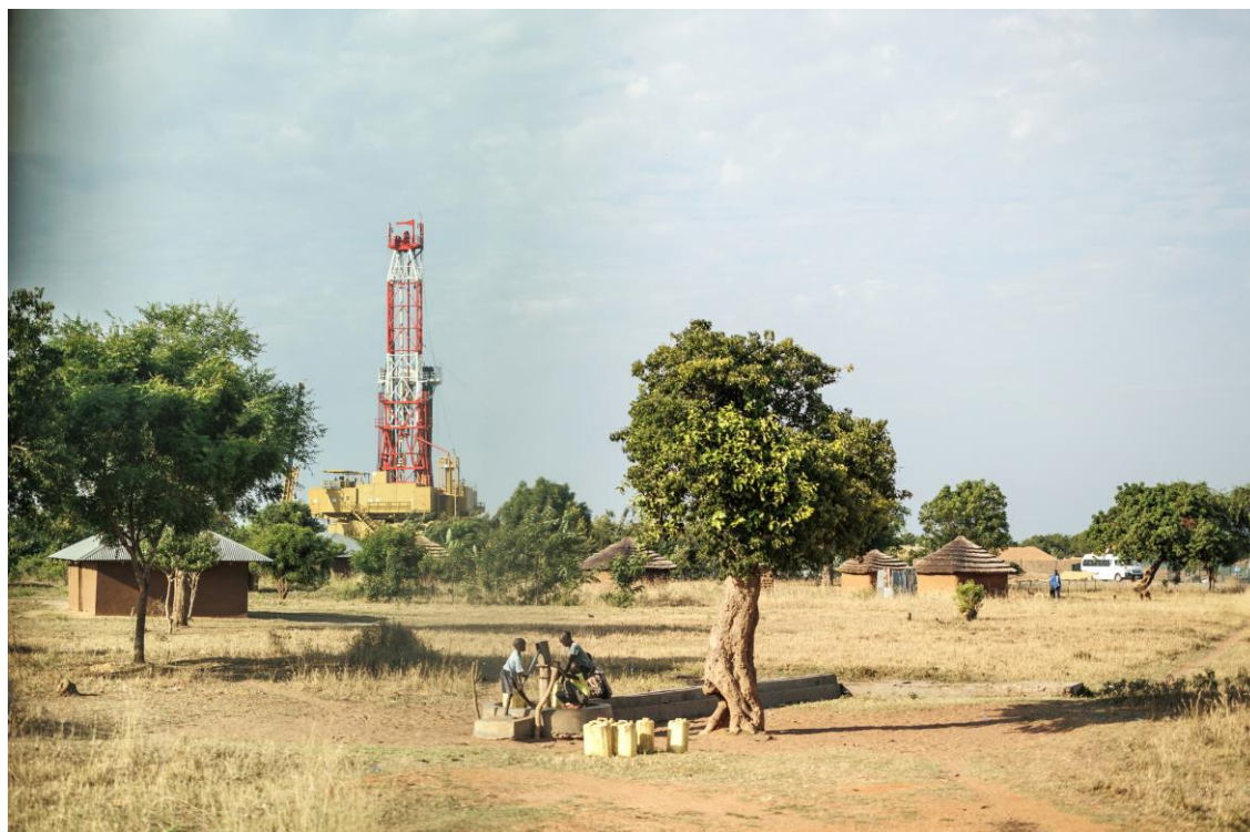
Des habitants de Buliisa en Ouganda ont vu des plateformes pétrolières surgir derrière chez eux.

côté du gouvernement ont été proposés, ce qui a renforcé la pression exercée sur les populations. Un agriculteur tanzanien se souvient avoir posé des questions à un avocat à propos des faibles taux de compensation. Pour toute réponse, voici ce qu'on lui a dit : « Si vous avez des problèmes, vous pouvez faire un procès au gouvernement. »