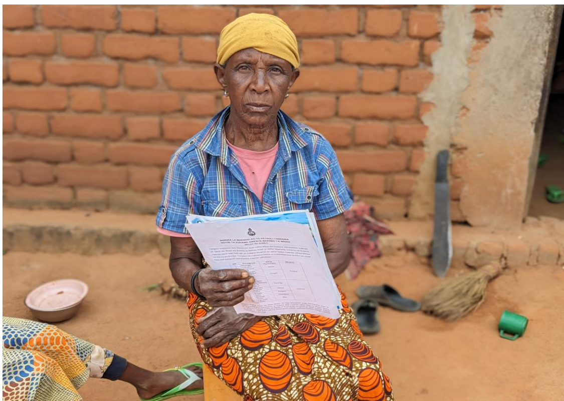
Une femme montre un avis d'expulsion envoyé par Tanzania Petroleum Development Corporation.