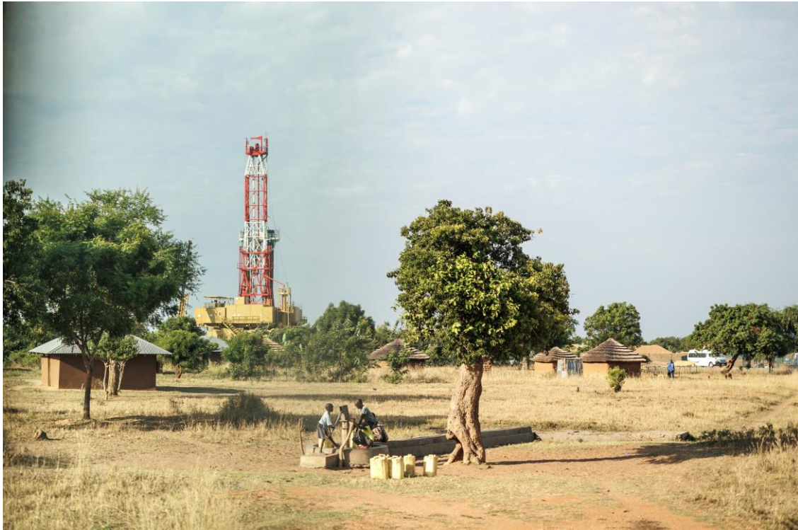
Jamii za Buliisa, Uganda, zimeona mitambo ya kuchimba mafuta ikitokea karibu na mashamba yao.

Wanajamii wanasema waliambiwa na maafisa wa kampuni na maafisa wa serikali - wakati mwingine wakiandamana na vikosi vya usalama - kwamba hawakuwa na chaguo ila kukubali viwango vya fidia vya chini, kwamba mradi huo ungeendelea kwa hali zote na kwamba hawana uwezo wa kulinda haki zao na kuongea lolote dhidi ya serikali. Wale waliokataa wanasema walitishiwa kuchukuliwa hatua za mahakama, na wakazidi kulazimishwa na makampuni na maafisa wa serikali. Waliambiwa msaada wao pekee ni kuchukua hatua za kisheria, ambazo mwishowe waliambiwa zitafeli na itawagharimu pesa nyingi.