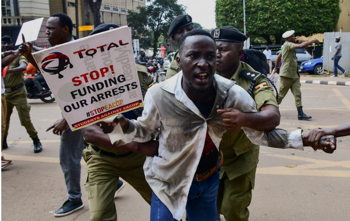
Wanafunzi wanne walikamatwa kwa nguvu mnamo Septemba 2023 kwa kuandamana dhidi ya EACOP.