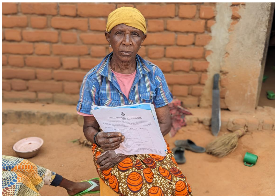
Une femme montre un avis d'expulsion envoyé par Tanzania Petroleum Development Corporation. (Green Conservers)

Mtetezi mmoja wa kike alisema amepunguza juhudi zake za utetezi dhidi ya EACOP kutokana na shinikizo, badala ya fidia bora na haki kwa wanawake. "Huwezi kutetea chochote ukiwa umekufa," alisema. Mwanaharakati mwingine wa kike alielezea kuwa alipata "mateso ya kisaikolojia", huku familia yake ikiishi kwa hofu. Wengine wamejificha au kuhama kila mara kutoka mahali pamoja hadi mahali pengine ili kuepuka kunyanyaswa na wenye mamlaka.