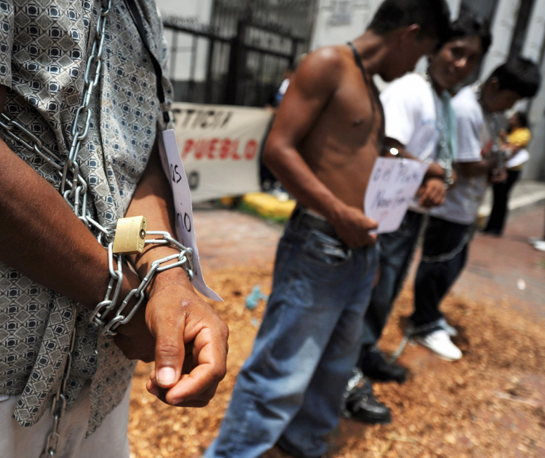
Activistas indígenas Naso se encadenan uno al otro durante una protesta en el Palacio Presidencial en la Ciudad de Panamá, en 2009. El pueblo Naso ha exigido el reconocimiento formal de sus derechos a la tierra por décadas.