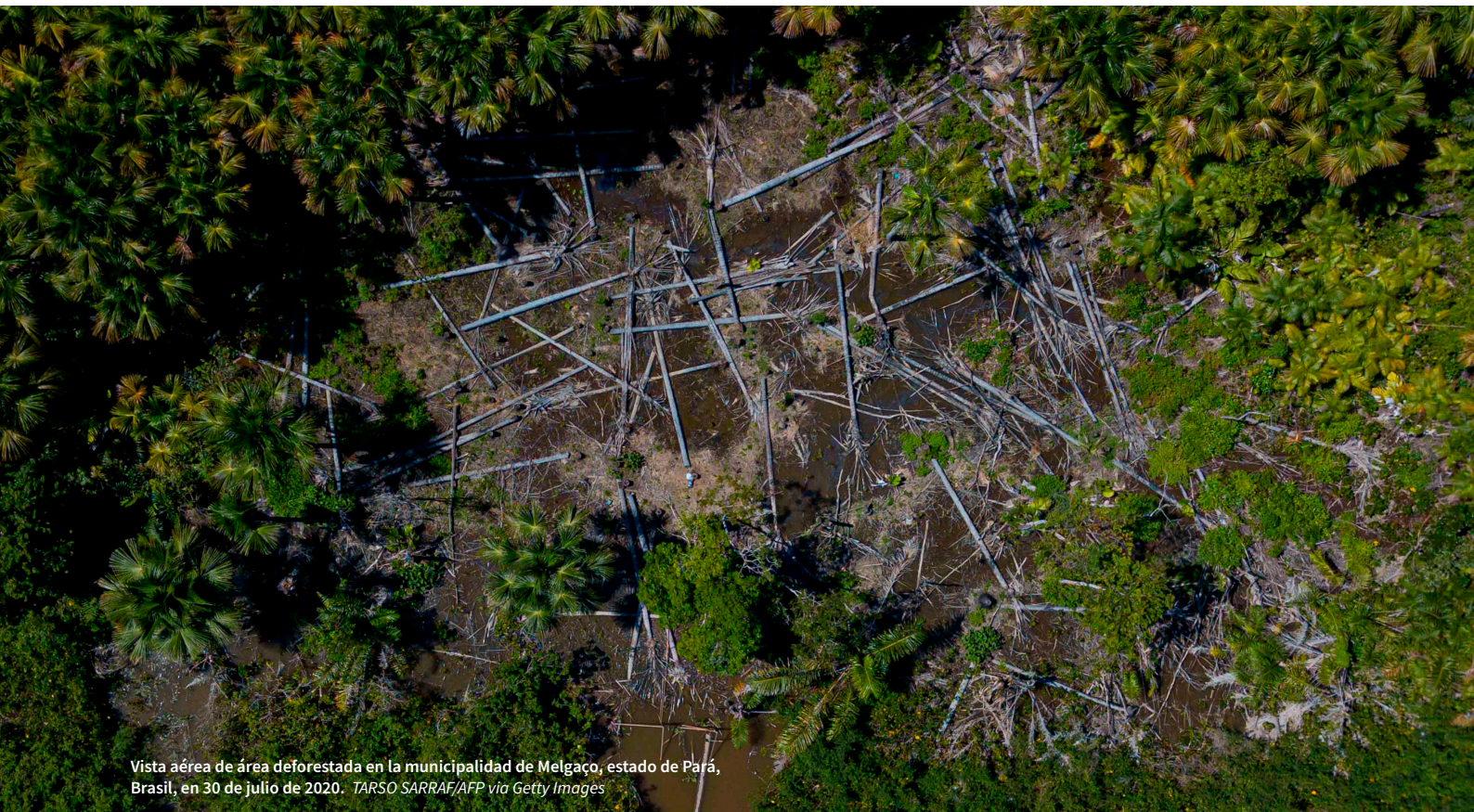
Vista aérea de área deforestada en la municipalidad de Melgaço, estado de Pará, Brasil, en 30 de julio de 2020.

* Definimos a las personas defensoras de la tierra y el medioambiente como aquellas que adoptan una posición firme y pacífica contra la explotación injusta, discriminatoria, corrupta o perjudicial de los recursos naturales o del medioambiente. Para más detalles, puedes ver nuestra metodología en la página 27.