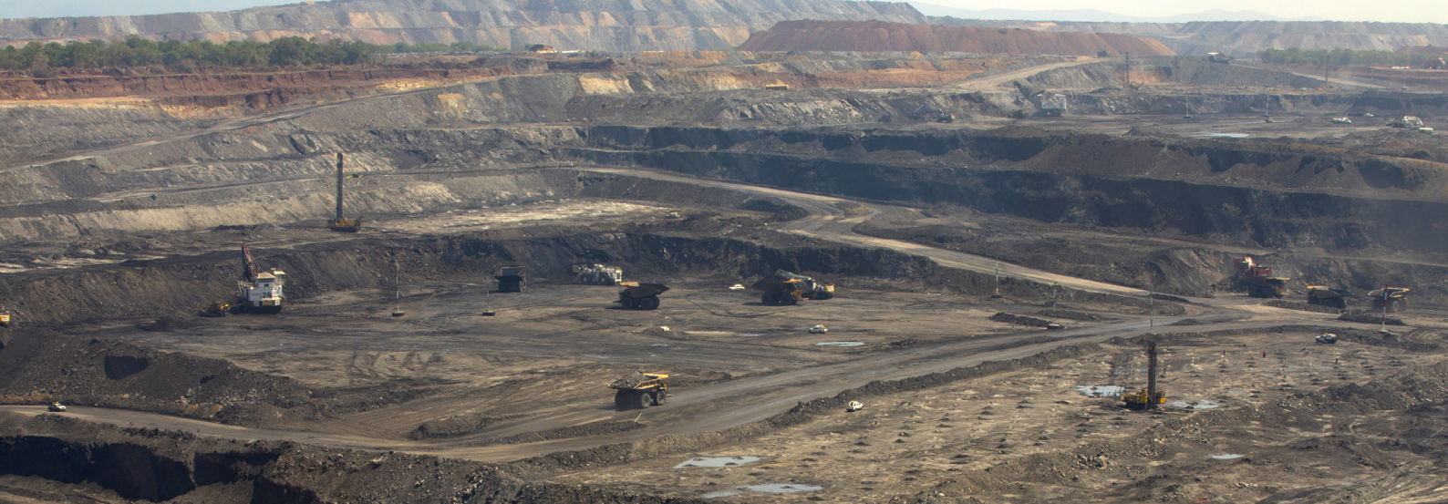
Maquinaria operando en una mina anexa a la mina de carbón Cerrejón en Barrancas, La Guajira, Colombia.